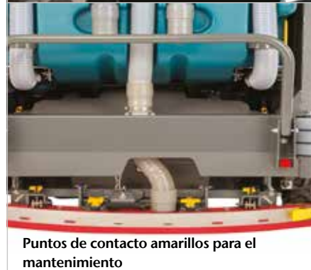
Puntos de contacto amarillos para el mantenimiento

Tejadillo de protección que previene que el operario sea golpeado por objetos que salgan despedidos.