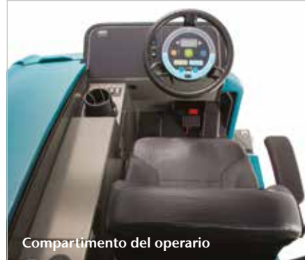
Compartimento del operario