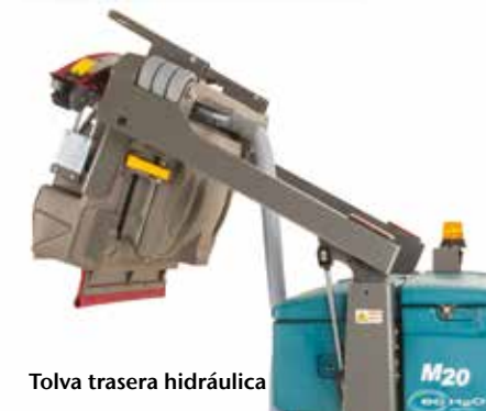
Tolva trasera hidráulica