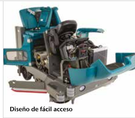
Diseño de fácil acceso